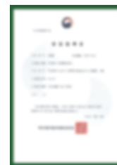
Giấy chứng nhận đăng ký kinh doanh thực phẩm nhập khẩu