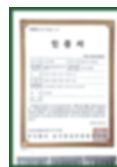
Chứng nhận thực phẩm chế biến gia công hữu cơ