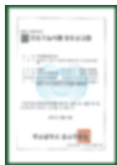
Giấy chứng nhận đăng ký kinh doanh thực phẩm chức năng