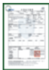
Giấy chứng nhận khai báo nhập khẩu