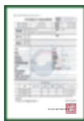
Giấy xác nhận khai báo nhập khẩu