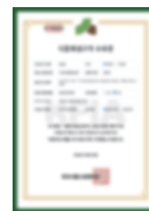
Giấy chứng nhận hoàn thành khóa đào tạo vệ sinh an toàn thực phẩm