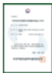
Chứng nhận của GMP