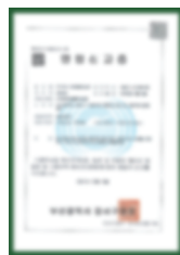
Giấy chứng nhận đăng ký kinh doanh phân phối chuyên nghiệp