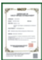
Chứng nhận của HACCP