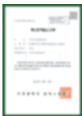
Giấy chứng nhận đăng ký kinh doanh thương mại điện tử (bán hàng online)