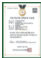
Giấy chứng nhận hoàn thành khóa đào tạo thực phẩm chức năng