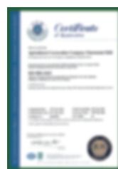
Chứng nhận của ISO