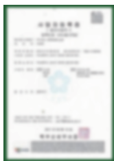
Giấy chứng nhận đăng ký kinh doanh