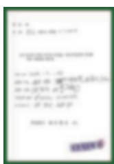
Giấy chứng nhận xuất xứ (C/O)