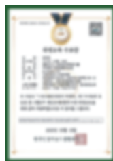
Giấy chứng nhận hoàn thành khóa đào tạo quản lý an toàn thực phẩm nhập khẩu